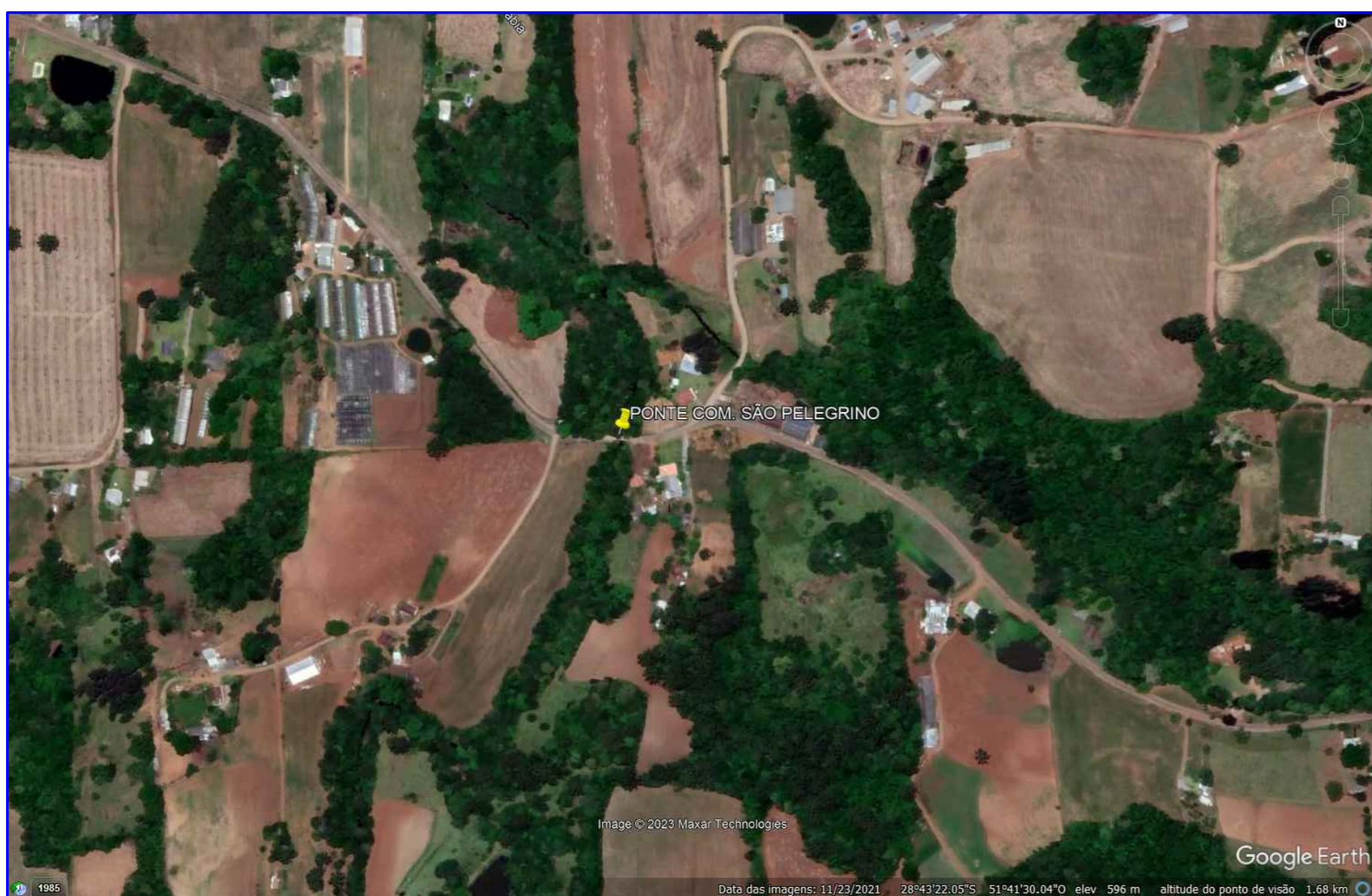
Ponte Comunidade São Pelegrino, Linha 10ª

PONTE 01 Latitude 28°43'27.67"S Longitude 51°41'19.03"O